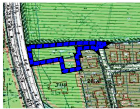
LOKALIZACJA OBSZARU OBJĘTEGO ZMIANĄ PLANU

Fragment miejscowego planu zagospodarowania przestrzennego Miasta Kluczborka, część południowa uchwała nr XXV/259/12 z dnia 28.09.2012 r.