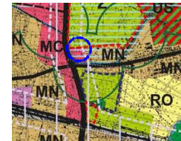
LOKALIZACJA OBSZARU OBJĘTEGO ZMIANĄ PLANU

WYRYS ZE STUDIUM UWARUNKOWAŃ I KIERUNKÓW ZAGOSPODAROWANIA PRZESTRZENNEGO GMINY KLUCZBORK /uchwała nr XXVI/230/16 Rady Miejskiej w Kluczborku z dnia 12.07.2016r./