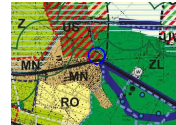
LOKALIZACJA OBSZARU OBJĘTEGO ZMIANĄ PLANU

WYRYS ZE STUDYUM UWARUNKOWAŃ I KIERUNKÓW ZAGOSPODAROWANIA PRZESTRZENNEGO GMINY KLUCZBORK uchwała nr XXVI/230/16 Rady Miejskiej w Kluczborku z dnia 12.07.2016r./